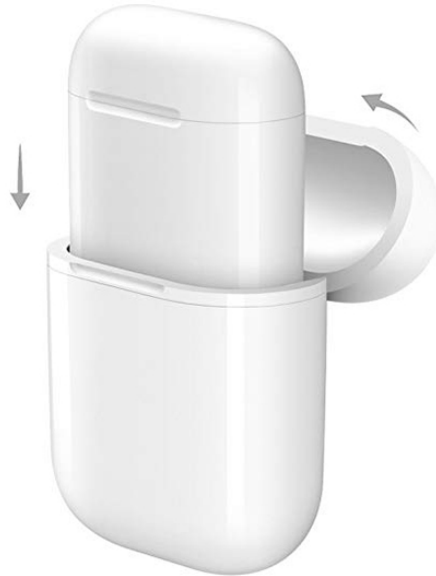
Schuif de airpods in de Qi Ontvanger

Om de Qi charger te gebruiken dient u te beschikken over Apple AirPods (niet inbegrepen), deze kunt u vervolgens in de Qi ontvanger schuiven zoals hieronder te zien.